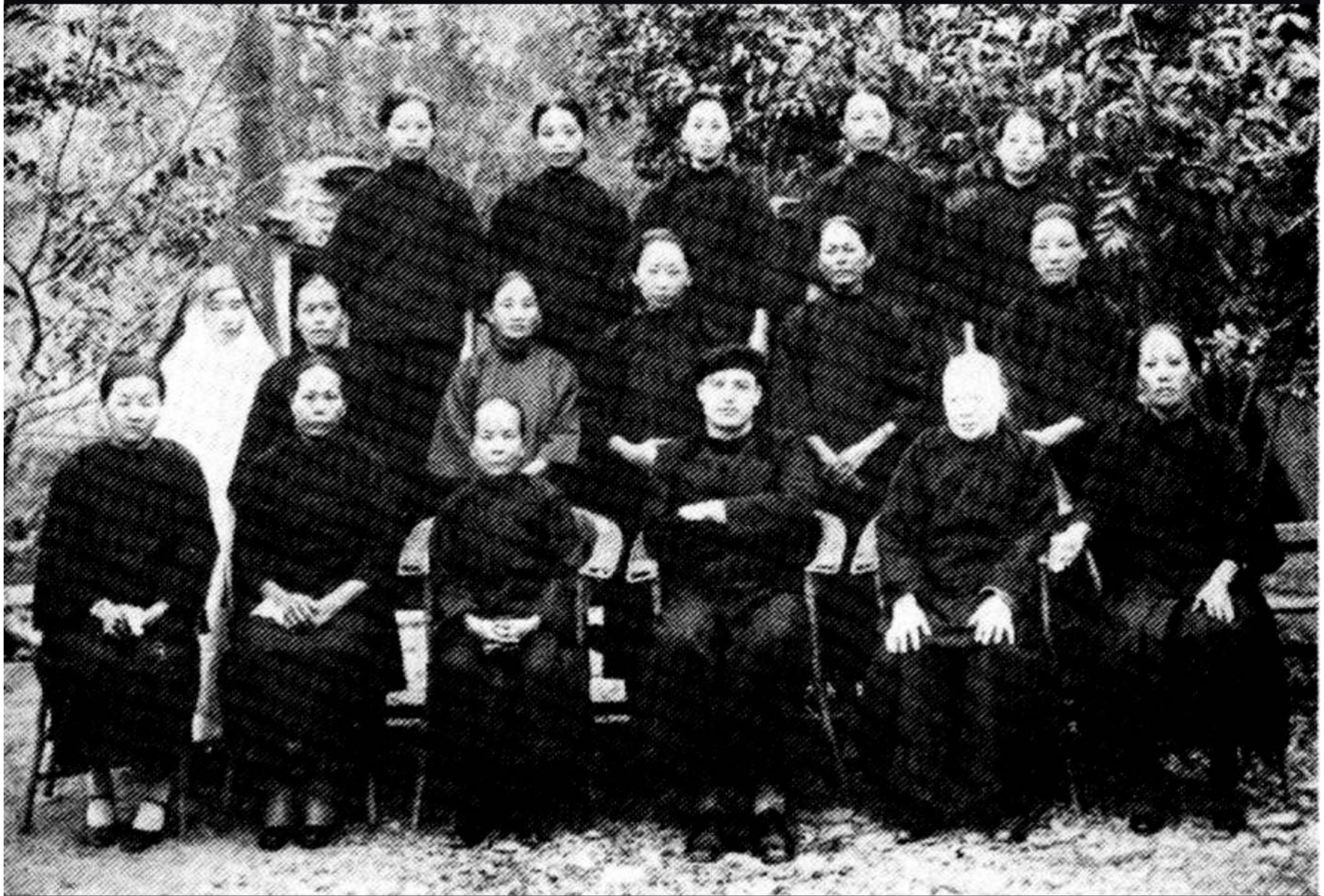
A group of devoted Catechists in Kaohsiung