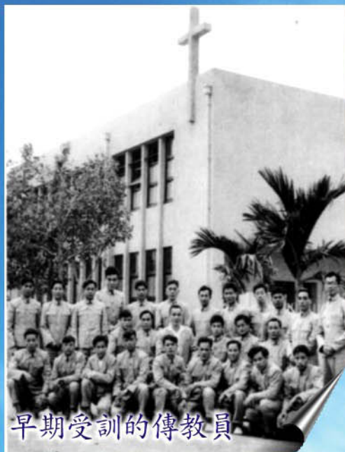
早期受訓的傳教員