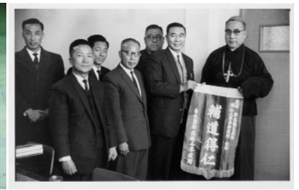
新莊各界獻旗歡迎建校