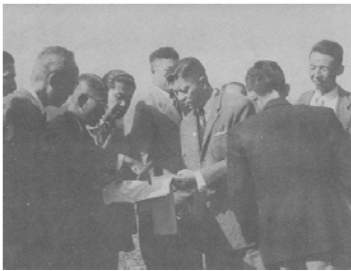
宜蘭爭取輔仁建校

在表面順利背後其實是波折不斷的。就中國教區神職選的北部校地而言，一開始的設定就是台北近郊且交通方便之處。現今交通便利的士林、淡水，當時都有交通條件上的限制。嘉義、宜蘭、花蓮的交通情況更差，只會是台北近郊找不到地時的不得已選擇。而地方所獻之地通常不是四方平整之地，開路整地或補償農地稻穀收成的費用，常多於直接買地的花費，此為當時由獻地轉為買地的原因，並非不接受地方政府的獻地。耶穌會及聖言會在高雄大貝湖的校地同樣面臨困難，這塊地夾在高雄市、高雄縣及屏東縣之間，三個地方政府為了分攤三四百萬元地上物補償，彼此僵持不下。在欲贈土地上，復有高雄工業給水廠之土地（以後的自來水公司），給水廠以水土保持、汙水排放等理由進行技術性阻擋，其間亦有整地費用、開路問題等，遂使此塊已簽約的土地遲遲不能移交。