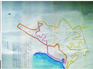
大貝湖校地預定圖