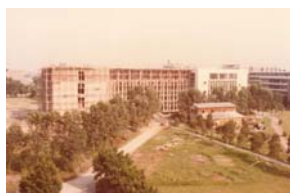
外語系（外語學院教學大樓）